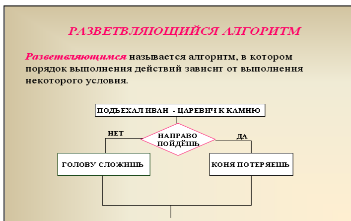
Рисунок 3 - Пример слайда.

Каждый слайд КП должен иметь заголовок, количество слов на слайде не должно превышать 40 (Рисунок 3).