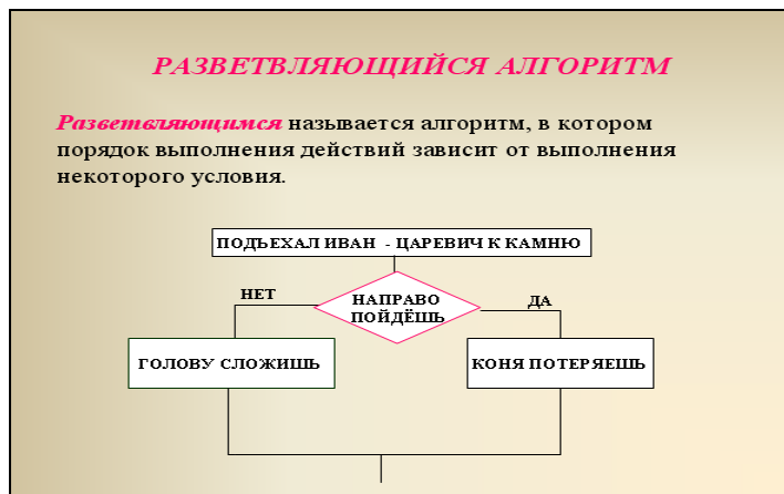
Рисунок 3 - Пример слайда.

Каждый слайд КП должен иметь заголовок, количество слов на слайде не должно превышать 40 (Рисунок 3).