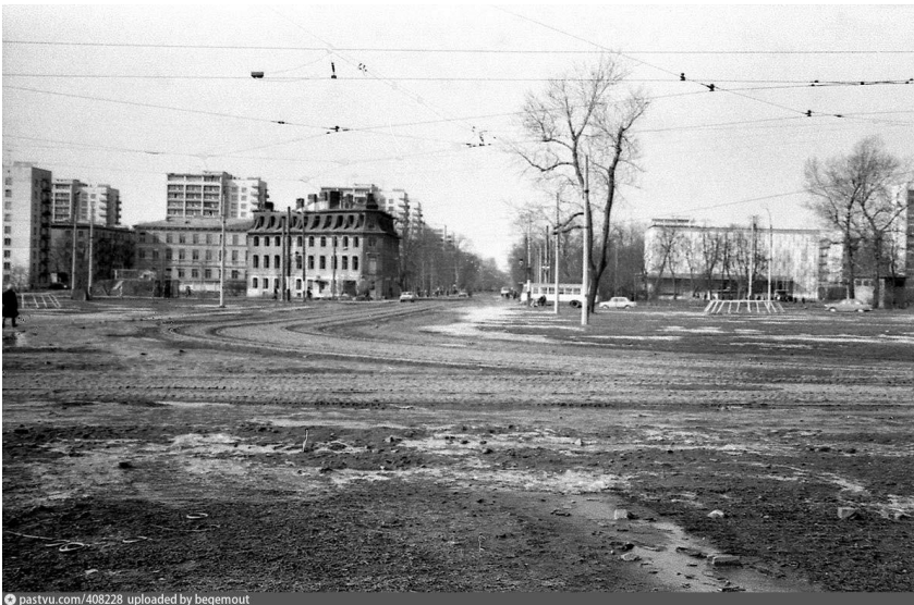
Площадь Мужества. 60-ые годы.