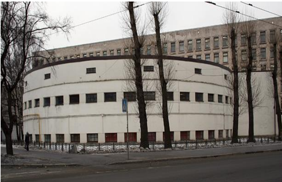
Круглая баня на площади Мужества. Работала в блокаду, ходили все, военные и гражданские, кто мог.